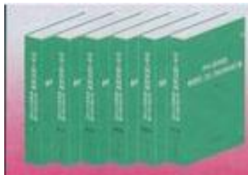
十一届三中全会以来制定的 有关法律、法规文本