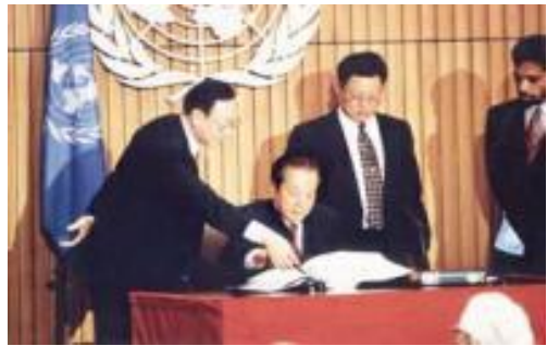
④签署《全面禁止核试验条约》