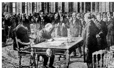
④巴黎和会上拒绝中国的正当要求