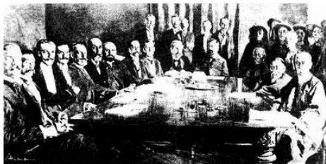
③《辛丑条约》陷中国于半殖民地深渊