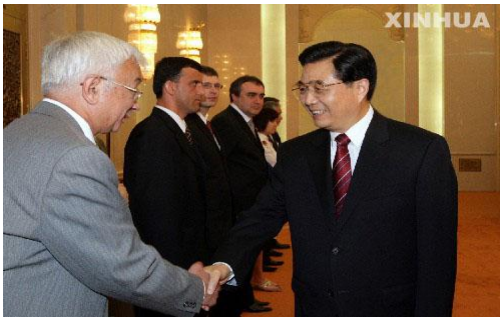
③参加上海合作组织会议