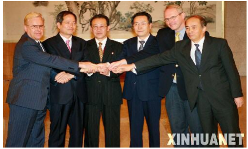
②参加朝核六方会谈