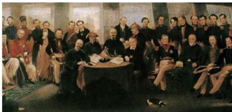
①《南京条约》开启中国屈辱历程

12. 2008 年 12 月 7 日中新网报道，当地时间 12 月 6 日，法国总统萨科齐在波兰华沙同窜访欧洲的达赖喇嘛见面，这严重伤害了中国人民的民族感情。下列事件中有法国参与并伤害了中国人民民族感情的是（ ）