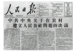
发表关于建立人民公社问题的决议