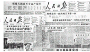
全国各地高产丰产的报道